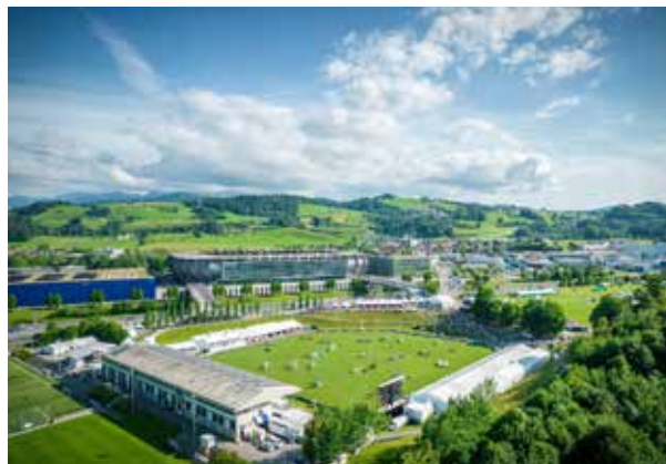
Das einzigartige Reitstadion Gründenmoos.