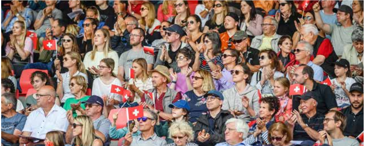
Jeder Fan gehört zum «Swiss Team»

Das Stadion brodelte. Ein Meer aus rot gekleideten Fans schwingt Schweizerfahnen, aufgemalte Schweizerkreuze zieren vor Aufregung gerötete Wangen.