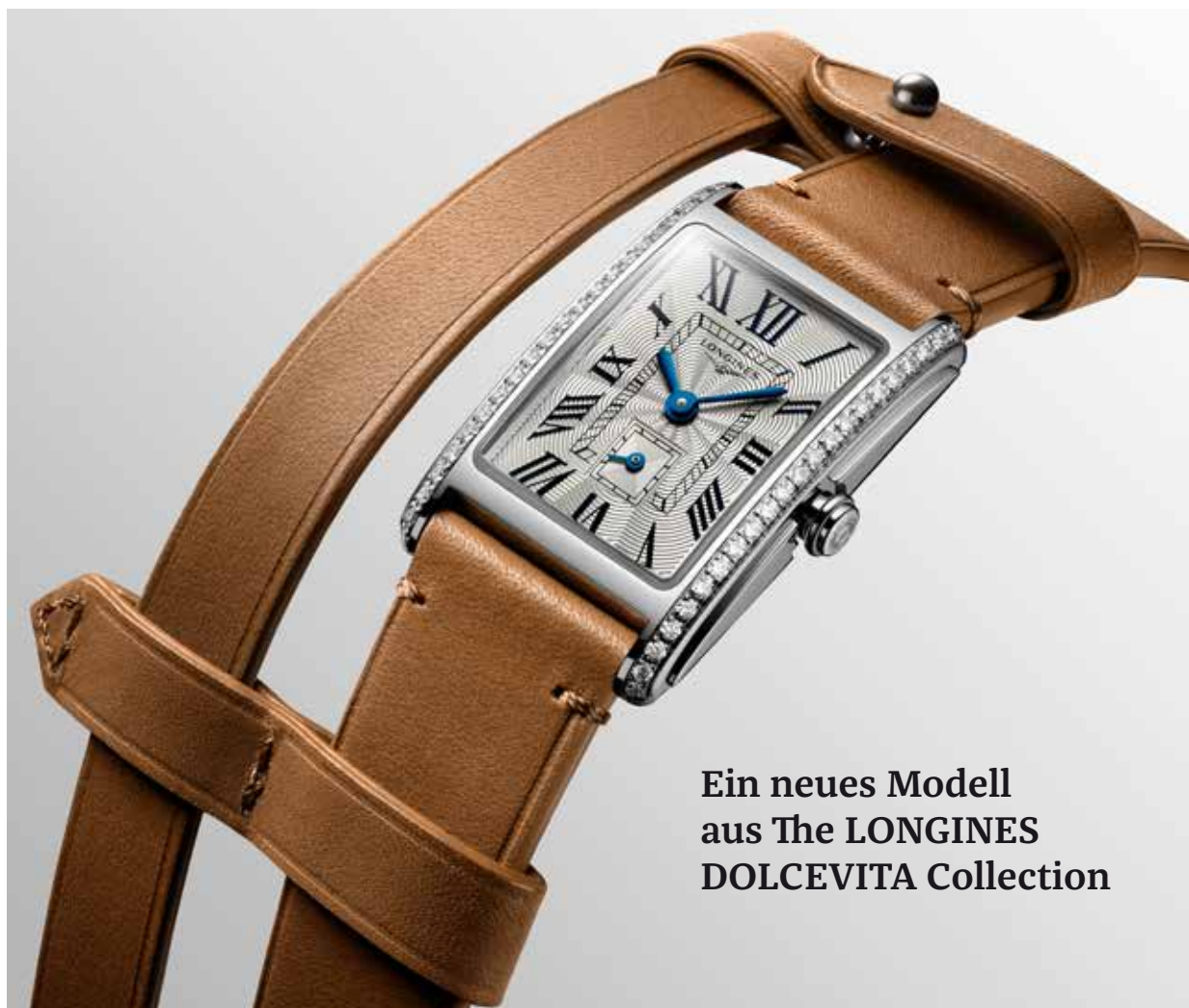
Ein neues Modell aus The LONGINES DOLCEVITA Collection

ihrem Label YVY entworfen, dessen hochwertige Leder-Accessoires bei internationalen Stars genauso beliebt und begehrt sind wie bei einem Publikum, das es exklusiv mag. Die Welten von Longines und YVY ergänzen sich perfekt und fanden fast instinktiv zu einer Kollaboration zusammen. Die neuartigen Armbänder der Longines DolceVita X YVY Modelle sind aus Leder hergestellt und werden durch Metallelemente verstärkt und geschmückt. Ihre makellose Umsetzung weist mit ihrem markanten Design explizit auf die Welt des Pferdesports, die der Marke mit der geflügelten Sanduhr so am Herzen liegt.