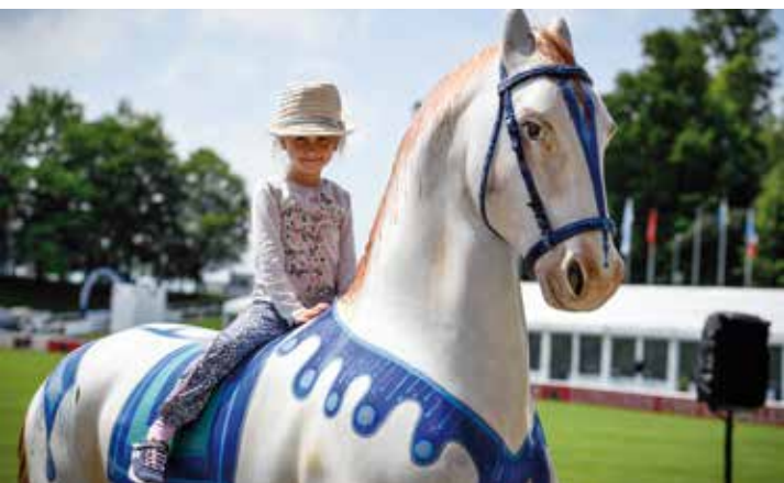
Den Auftakt bildet wie gewohnt der beliebte Kindernachmittag am Mittwoch mit viel Action, Spiel und Spass.

Der Longines CSIO St.Gallen bietet im Gründenmoos und dem Erlebnispark Breitfeld neben Weltklasse-Pferdesport auch eine Fülle an Programmangeboten für die ganze Familie.