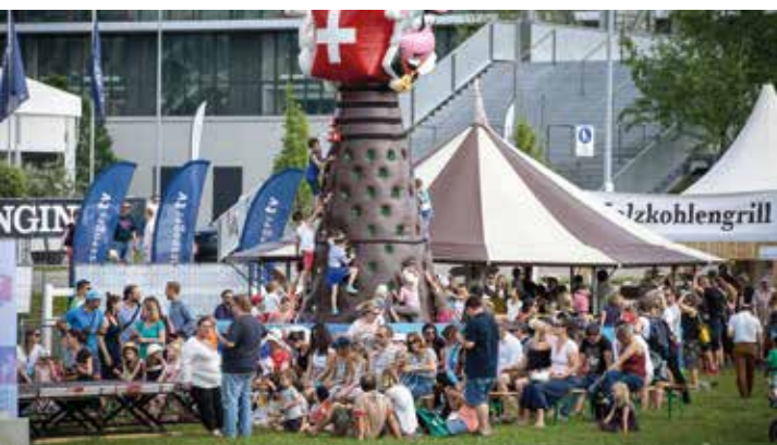
Im Kinderparadies ist mit Ponyreiten, Schminken, Basteln, Tor-schiessen und dem Kletterturm immer etwas los.