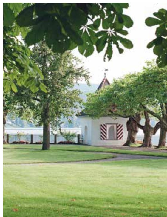
90 000 m 2 gepflegte Parkanlage bieten Raum für ausgiebige Spaziergänge.

Sporttherapeuten instruieren und betreuen die individuellen Trainings-