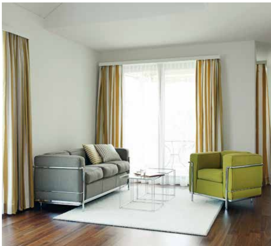
Lichtdurchflutete Zimmer tragen zum Wohlfühl bei.

Die erstklassige Hotellerie, die liebevoll zubereiteten Menüs und À-la-carte-Speisen sowie das stilvolle Interieur im