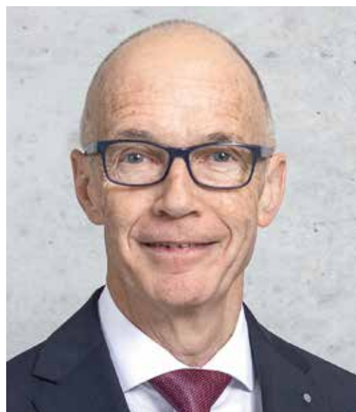
Thomas Scheitlin Stadtpräsident St.Gallen

und wünsche viel Erfolg. Ebenso herzlich willkommen heisse ich alle Gäste und wünsche Ihnen wunderschöne und spannende Reitsporttage.