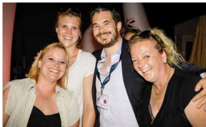
An der Calvaro Riders Party vom Donnerstag-, Freitag- und Samstag-abend mit DJ Tommy vom Alpenchique geht die Post ab.