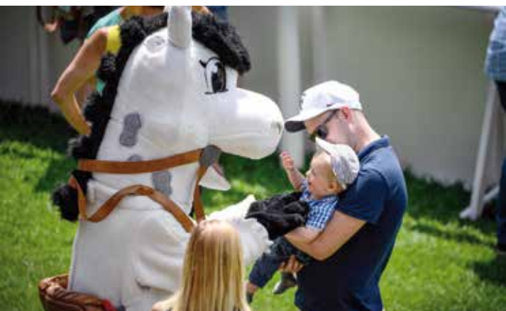
Wo auch immer unser Maskottchen Galoppi auftaucht bringt er Kinder zum Lachen.