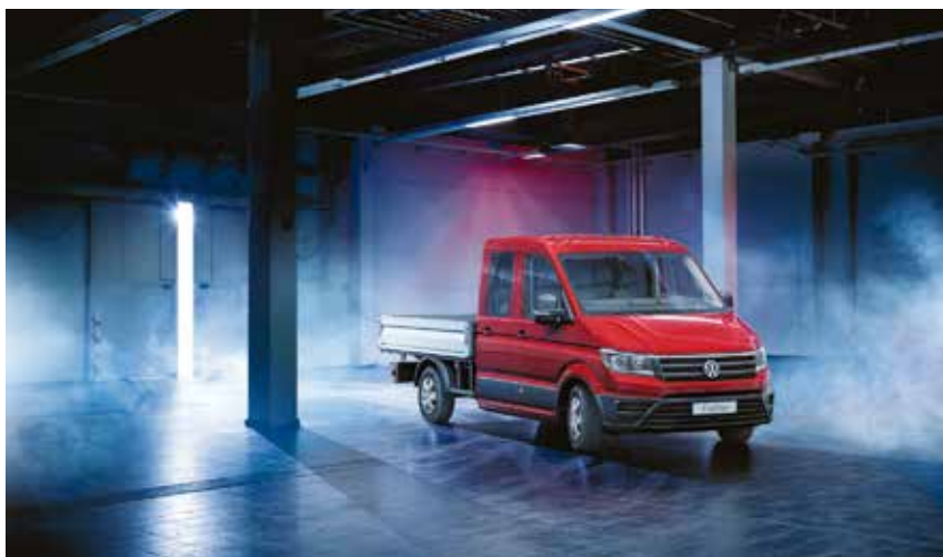
New Crafter Fight Programm 2018 mit Verkaufsprämien der Superlative

bezüglich Qualität und Leistung in keiner Weise hinteranstellen.