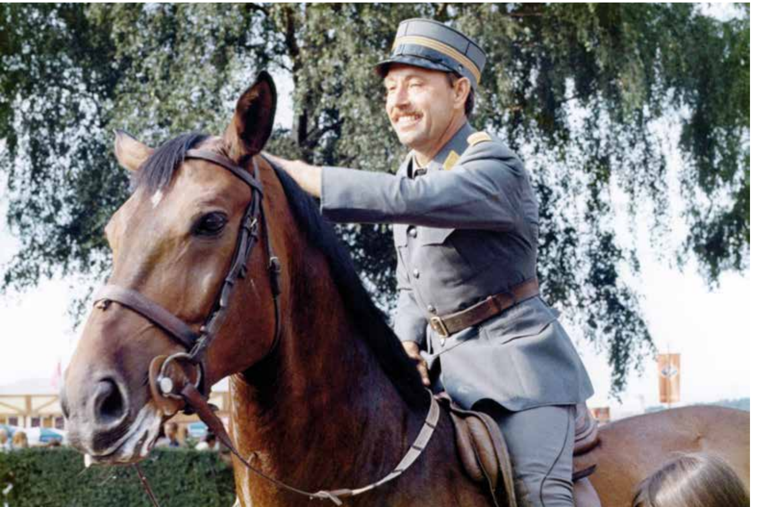
Paul Weier: Zwischen 1956 und 1975 holte er nicht weniger als 13 nationale Meistertitel.