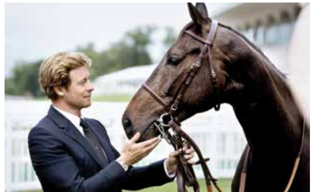
Der australische Schauspieler Simon Baker ist seit 2012 Longines-Markenbotschafter.

Um dieses Jubiläum gebührend in Szene zu setzen, erweitert Longines 2016 seine Charity-Unterstützung zugunsten von JustWorld International. Diese Organisation steht benachteiligten Kindern in Entwicklungsländern zur Seite und erhält seit mehreren Jahren durch Longines Rückenstärkung. Als erster internationaler Partneranlass von JustWorld International war der Longines CSIO Schweiz St.Gallen in die Geschichte eingegangen.