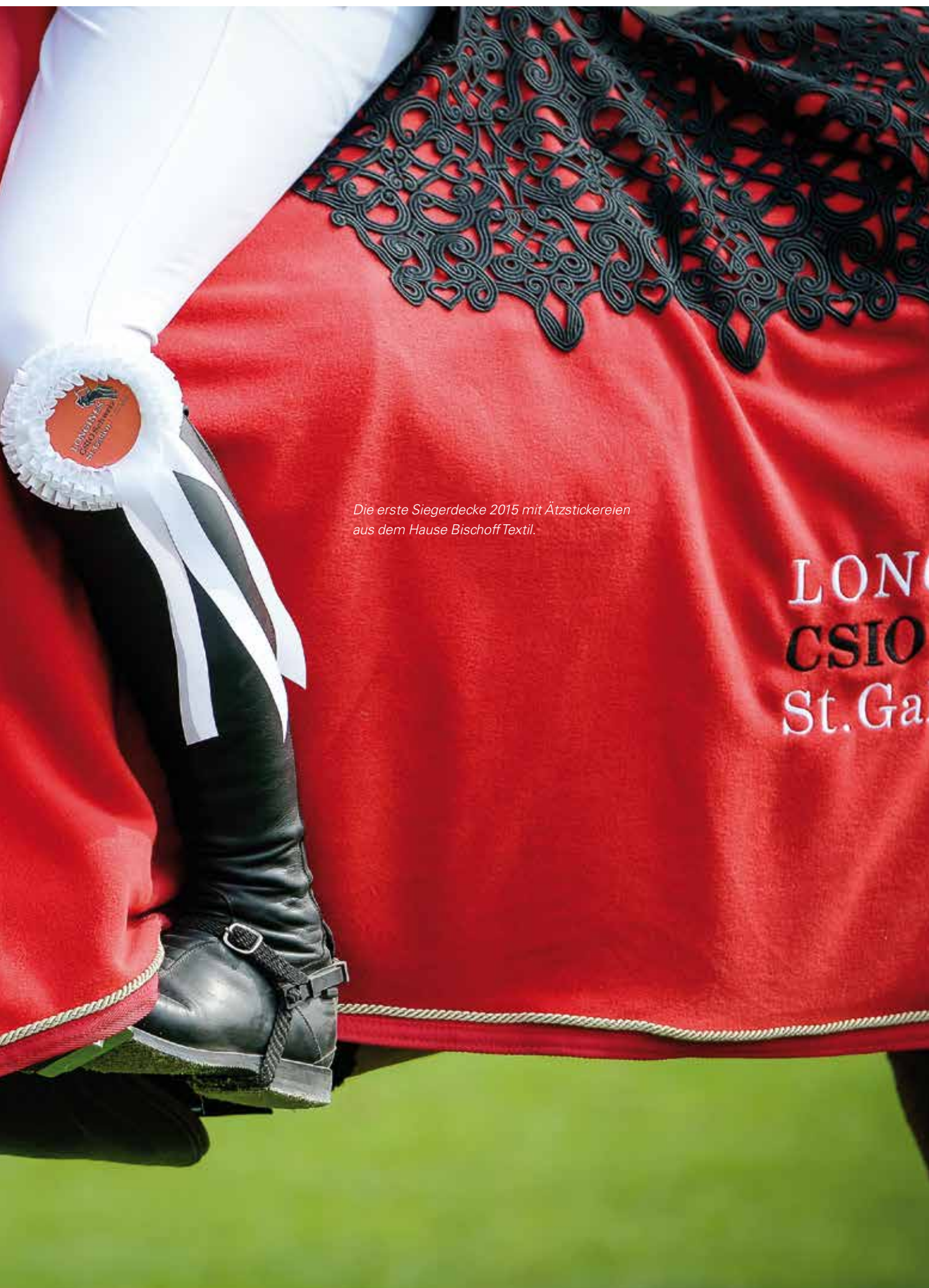
Die erste Siegerdecke 2015 mit Ätzstickereien aus dem Hause Bischoff Textil.