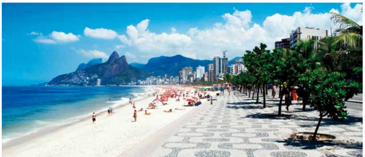
Die innerstädtische Copacabana ist der bekannteste Ort für Sonnenanbeter.

Fast etwas verloren wirken da der zentrale und von Kirchen umgebene historische Platz Largo de Carioca sowie der Largo do Boticário (Apothekerplatz). Seine ein- bis zweistöckigen Häuser im Kolonialstil liefen eine stimmungsvolle Kulisse für kulturelle Events.